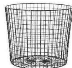
Panier de rangement en métal, Ø 28 cm x H 28 cm, H&M Home, 29,99 €.