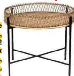
Table basse en bambou, Ø 60 x H 52 et Ø 49 x H 39,5 cm, Sema Design, 135 € les 2.