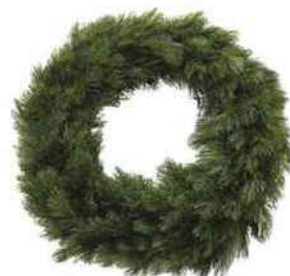
Couronne en PVC, Ø 45 cm, « Forest Frosted », Truffaut, 24 €.