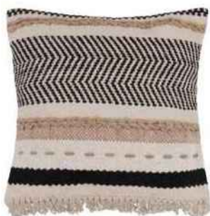
Coussin en coton écru imprimé, 45 x 45 cm, Maisons du Monde, 25,99 €.