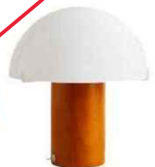
Lampe de bureau en bois, Ø 24,8 x H 28 cm, Zara Home, 59,99 €.