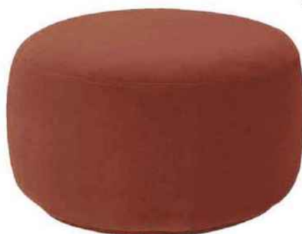
Repose-pieds en velours, Ø 60 x H 35 cm, « Rosebury », AM.PM, 390 €.