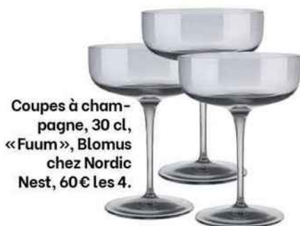
Coupes à cham- pagne, 30 cl, « Fuum », Blomus chez Nordic Nest, 60 € les 4.