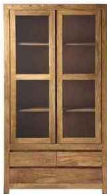
Vitrine en bois, H 200 x L 110 x P 45 cm, «Stockholm», Maisons du Monde, 999€.