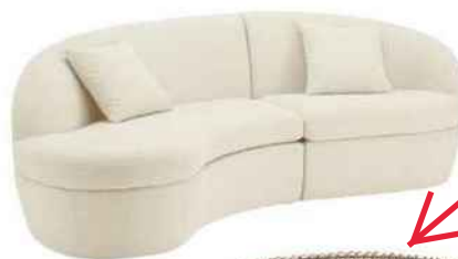
Canapé 3 pl. tissu bouclé, l. 218 cm «Reisa», Made.com, 1199 €.