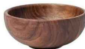
Bol en noyer, H 5 cm, The Conran Shop, 25 €.