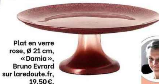
Plat en verre rose, Ø 21 cm, « Damia », Bruno Evrard sur laredoute.fr, 19,50 €.