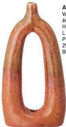
Arty Vase en grès émaillé, H 24,5 x L 12,5 x P 6,5 cm, 29,90 €, Bloomingville.