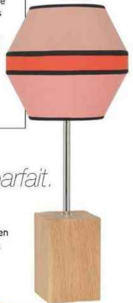
Rayée Lampe « Lollypop », en bois naturel, abat-jour en coton, H 87 x L 31 x P 31 cm, 225 €, Flam & Luce.