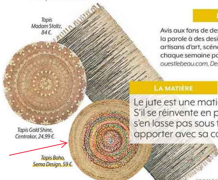
Tapis Madam Stoltz, 84 €.

Le jute est une matière naturelle fibrée de plus en plus plébiscitée. S'il se réinvente en pouf, en petite déco à poser çà et là, on ne s'en lasse pas sous forme de tapis ou de revêtement de sol pour apporter avec sa couleur sable un petit air de vacances.