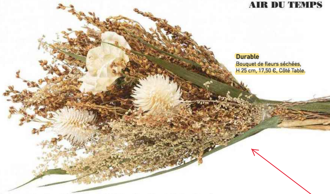
Durable Bouquet de fleurs séchées, H 25 cm, 17,50 €, Côté Table.