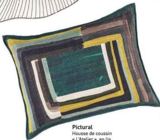
Pictural Housse de coussin « L'Atelier », en lin, 55 x 40 cm, 99 €, Élitis.