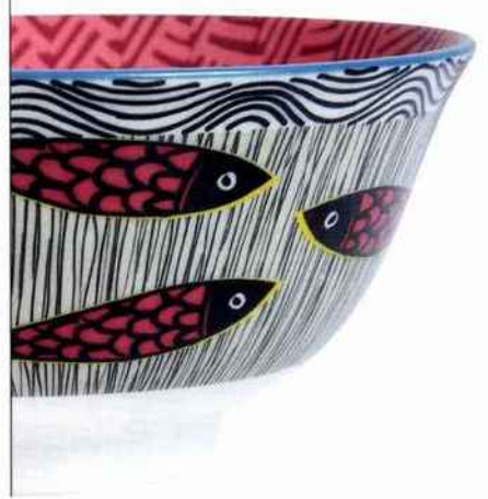
1. Assiette murale Poiscaille N°24, en faïence ancienne et mosaïque, Ø 22 cm, 60 €, Anis et Céladon chez Empreintes 2. Trousse Pablo, en lin brodé, 44 €, Iosis chez Yves Delorme 3. Sardines en chocolat au lait, 6,90 €, Le Comptoir de Mathilde 4. Housse de coussin Poséidon, en lin brodé, 33x57 cm, 79 €, Yves Delorme 5. Boucles d'oreilles Houat, en verre de Murano, 70 €, Stefano Poletti Bijoux chez Empreintes 6. Bol, en porcelaine, cont. 30 cl, 4,50 €, By Sophie C pour Jardin d'Ulysse