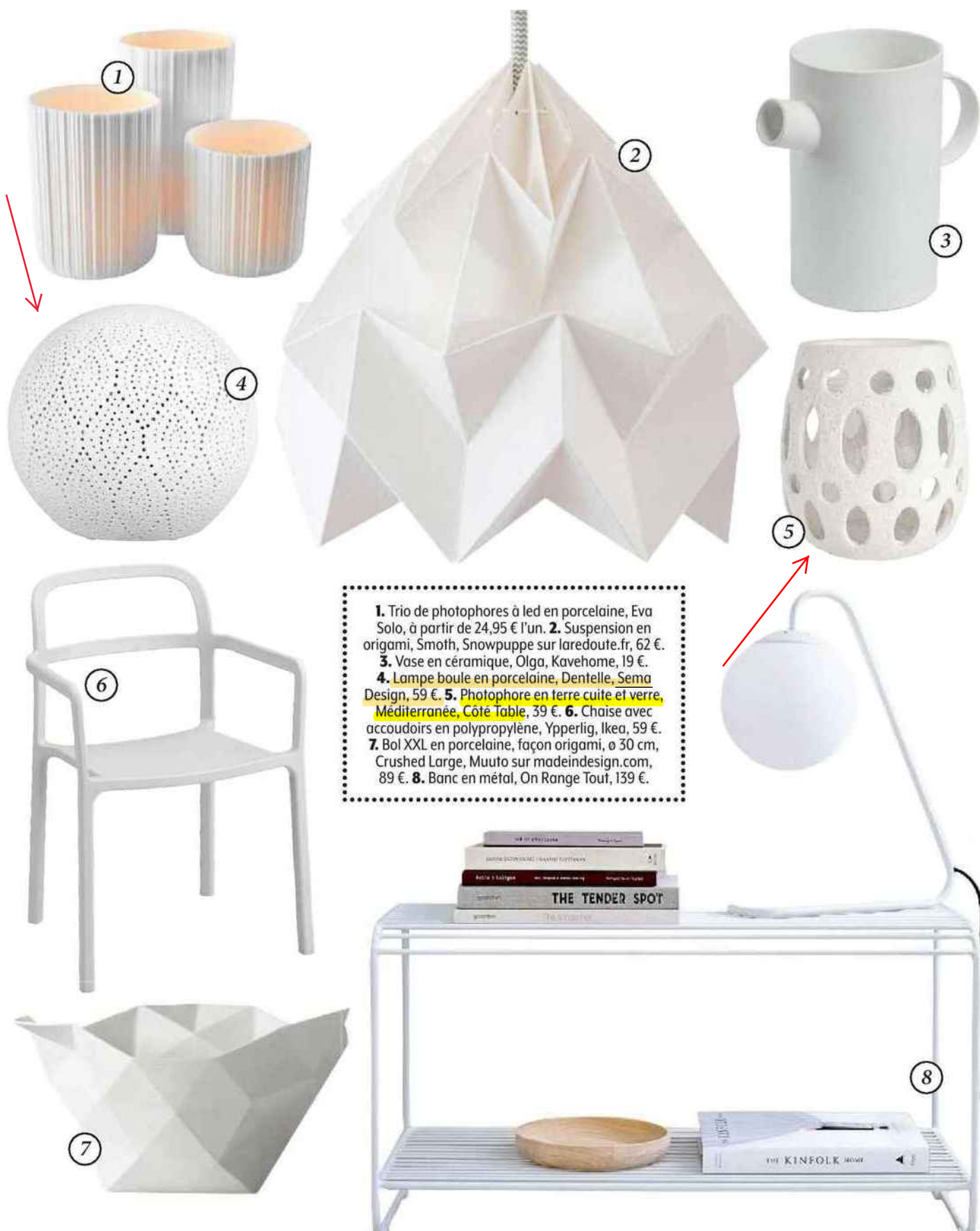
1. Trio de photophores à led en porcelaine, Eva Solo, à partir de 24,95 € l'un. 2. Suspension en origami, Smoth, Snowpuppe sur laredoute.fr, 62 €. 3. Vase en céramique, Olga, Kavehome, 19 €. 4. Lampe boule en porcelaine, Dentelle, Sema Design, 59 €. 5. Photophore en terre cuite et verre Méditerranée, Côte Table, 39 €. 6. Chaise avec accoudoirs en polypropylène, Ypperlig, Ikea, 59 €. 7. Bol XXL en porcelaine, façon origami, ø 30 cm, Crushed Large, Muuto sur madeindesign.com, 89 €. 8. Banc en métal, On Range Tout, 139 €.