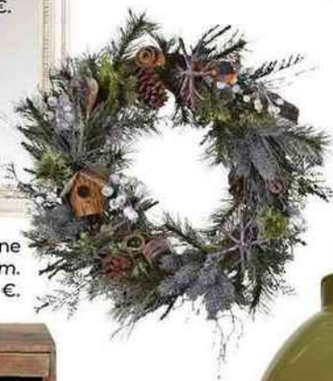
Forestière. Couronne en plastique, Ø 40 cm. Jardiland, 19,95 €.