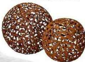
Ciselées. Sphères déco en métal, Ø 19 et 23 cm. Boule, Alinéa, 19 et 25 €.