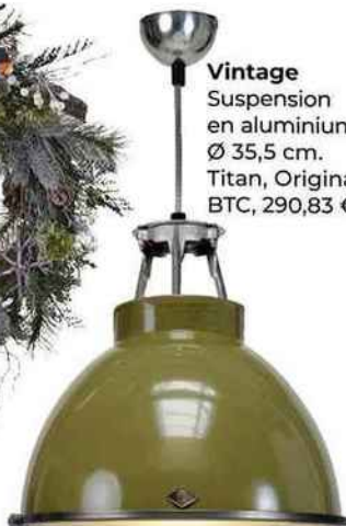
Vintage Suspension en aluminium, Ø 35,5 cm. Titan, Original BTC, 290,83 €.