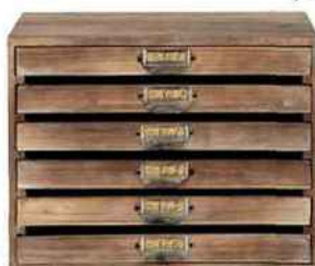
Patiné. Range-courrier en bois brut, L 36 x H 28 cm. Antoine, Maisons du Monde, 69,99 €.