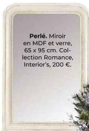
Perlé. Miroir en MDF et verre, 65 x 95 cm. Collection Romance, Interior's, 200 €.