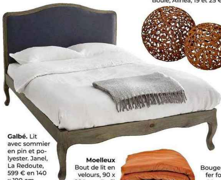
Galbé. Lit avec sommier en pin et polyester. Janel, La Redoute, 599 € en 140 x 190 cm.

Plutôt que d'accrocher un grand miroir au mur, posez-le au sol, à côté du lit ou près d'un fauteuil. Il se fait alors moins formel, tout en agrandissant l'espace.