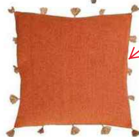
Pomponné. Coussin en toile de jute, 45 x 45 cm. Nostalgy, Côté Table, 38 €.